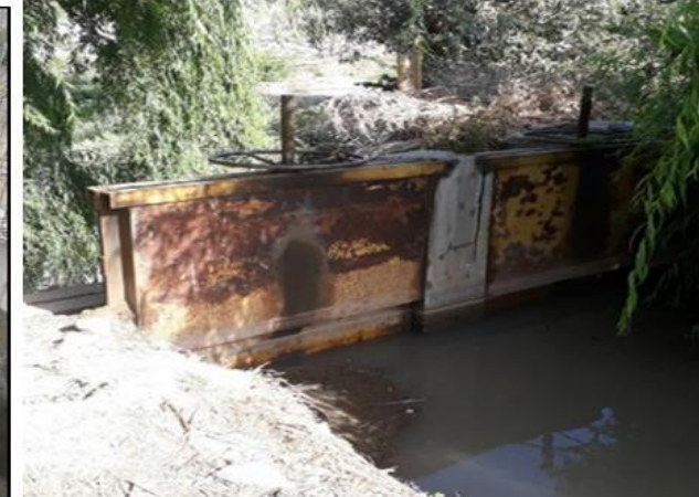
Foto 3. Canal Del Cerro.