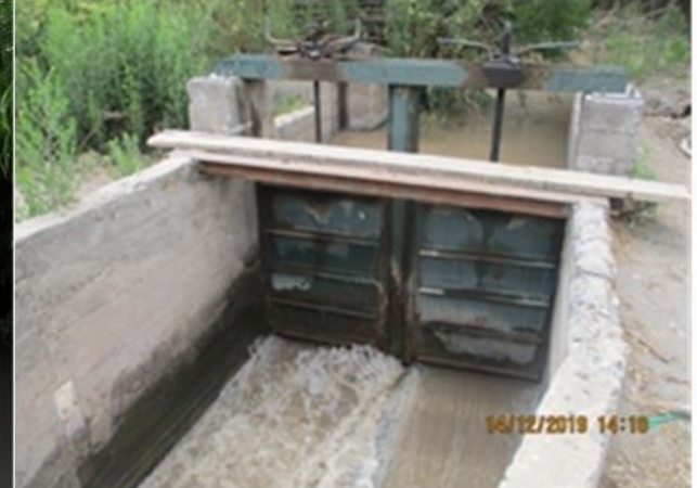
Foto 4. Canal Comunidad Panquehue.