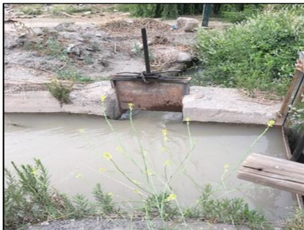
Foto 1. Canal La Pirca y El Pueblo.