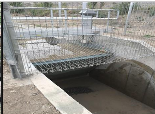
Foto 2. Canal Santa Rosa.